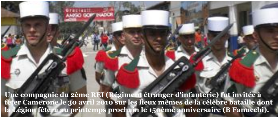
Une compagnie du 2 ème REI (Régiment étranger d'infanterie) fut invitée à fêter Camerone le 30 avril 2010 sur les lieux mêmes de la célèbre bataille dont la Légion fêtera au printemps prochain le 150 ème anniversaire.