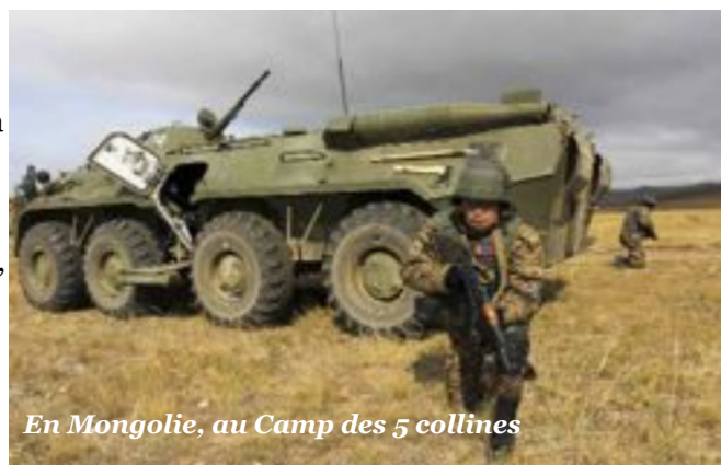
En Mongolie, au Camp des 5 collines