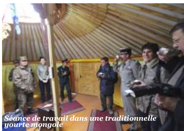
Séance de travail dans une traditionnelle yourte mongole