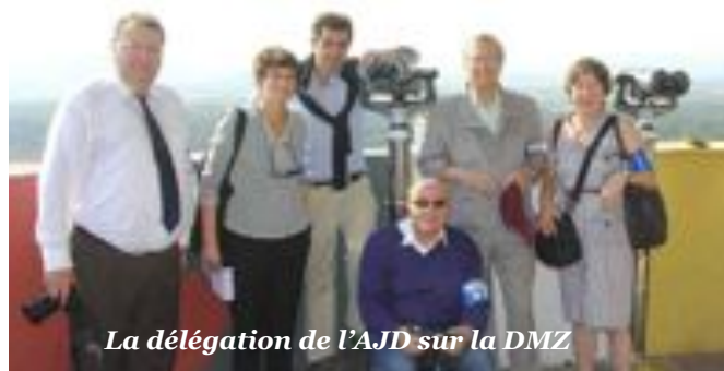
La délégation de l'AJD sur la DMZ