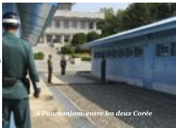
A Panmunjom, entre les deux Corée

En Corée du Sud, l'AJD eut droit d'abord à une visite commentée de la zone démilitarisée (DMZ) à Panmunjom, entre les deux Corée, une visite placée sous les auspices de l'U.S. Army qui est encore très présente dans le pays. Nous y rencontrâmes et fûmes fort bien reçus par des membres suisses et suédois de la Commission des observateurs neutres