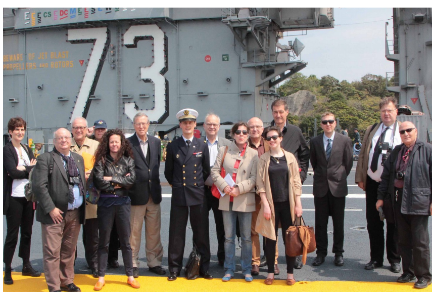
Sur le porte-avions USS G. Washington

Nous n'étions peut-être pas les 7 Samourais, mais les douze Ajidiens qui visitèrent le Japon du 11 au 18 avril, ont fait un voyage qui restera longtemps dans les mémoires. Quelle société étonnante d'organisation et de propriété, mais surtout, quelle infinie courtoisie et civilité de ses habitants entre eux et envers les étrangers venus visiter le pays. La guerre y est légalement proscrite mais les forces japonaises dites d'auto-défense sont parmi les armées les plus puissantes d'Asie.